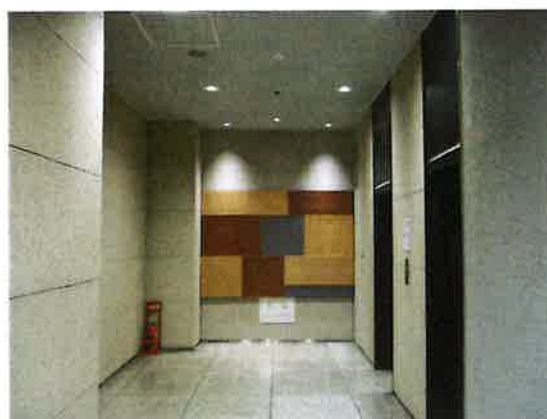
1 階エレベーターホール