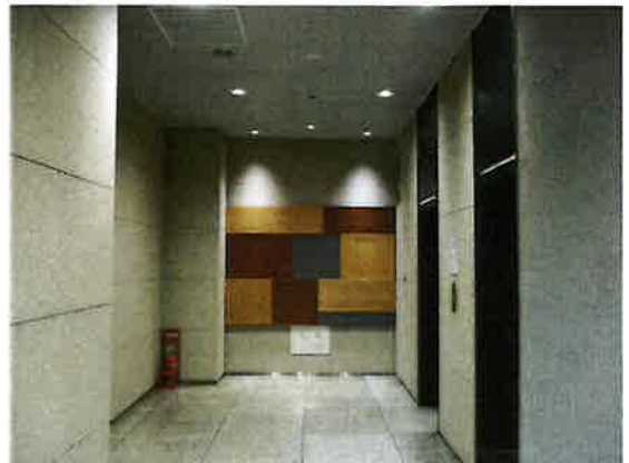
1 階エレベーターホール